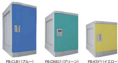
PB-CLB1(ブルー) (ベース付) W310×D470×H638 内寸/266×417×555 PB-DMG1(グリーン) (ベース付) W310×D470×H492 内寸/266×417×410 PB-KSY1(イエロー) (ベース付) W310×D470×H405 内寸/266×417×322