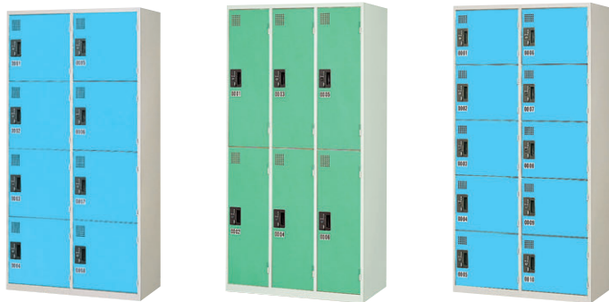
① KR-2408SLB (ライトブルー) ② KR-3206SLM(ライトグリーン) ●ハンガーパイプ、鏡板1枚付 ③ KR-2510SLB (ライトブルー)