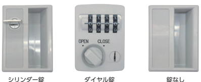
シリンダー錠 ダイヤル錠 錠なし