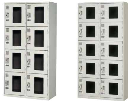
④ KR-2408ALG (ライトブルー) ⑤ KR-2510ALG (ライトブルー)